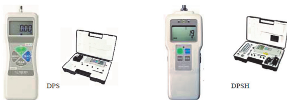
Livré avec 6 attaches, adaptateur secteur, mallette de transport